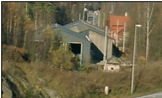
Del C har materialisert seg bak den gamle vognhallen på Vinterbro.

Hovedaktiviteten på Vinterbro i år har vært å føre opp den foreløpig siste planlagte vognhallsforlengelsen på stedet, kalt del C. Dette er nærmest en "forlengelse" av del B som er oppført på baksiden av den gamle vognhallen. Torsdag 6. november stod bygningen ferdig. Det gjenstår å anskaffe porter til del C.